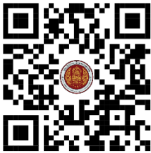
สาขาวิชาช่างไฟฟ้า