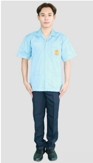
นักเรียน นักศึกษาชาย