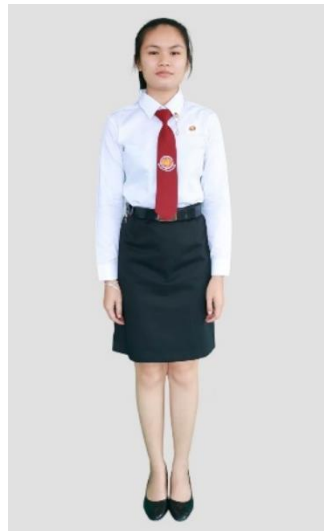
นักศึกษาหญิง