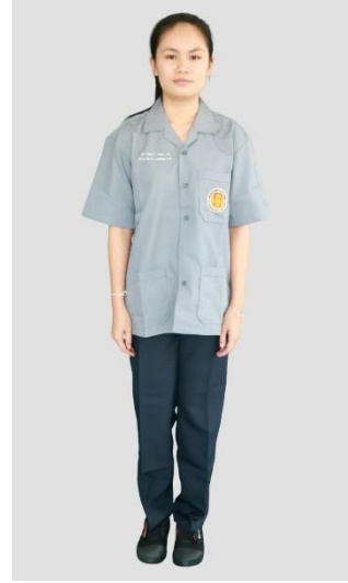
นักศึกษาหญิง