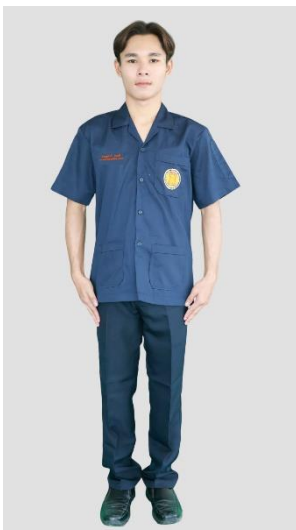
นักเรียนชาย