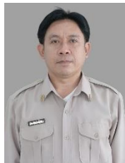
นายพลการ ไน้งษ์ งานกิจกรรมนักเรียน นักศึกษา งานปกครอง งานโครงการพิเศษและบริการชุมชน