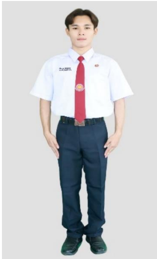
นักเรียนชาย