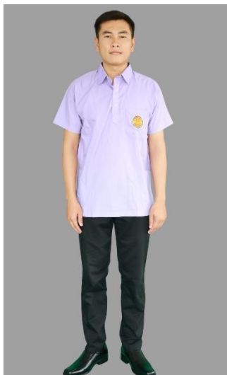
นักเรียน นักศึกษาชาย