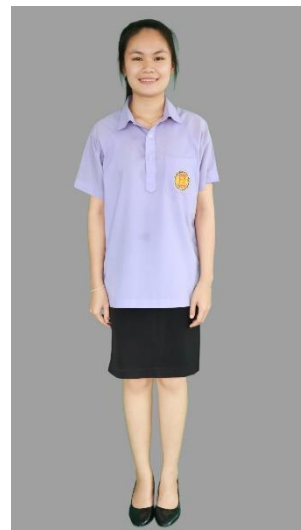
นักเรียน นักศึกษาหญิง