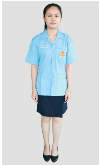
นักเรียน นักศึกษาหญิง