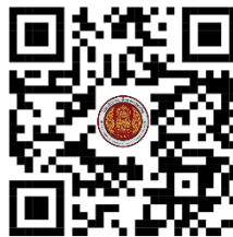
สาขาวิชาเทคโนโลยีธุรกิจดิจิทัล