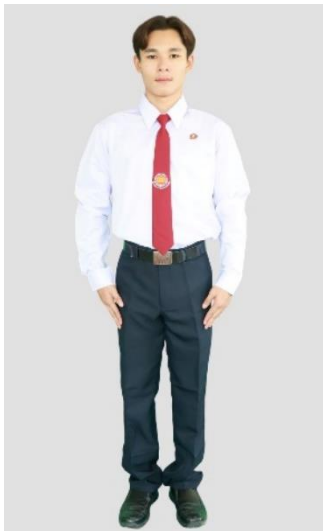
นักศึกษาชาย