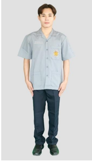
นักศึกษาชาย